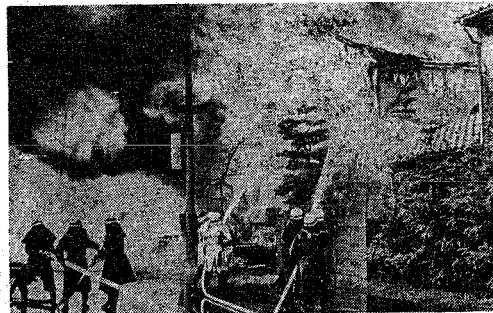
すぐ119番へノボヤと大火事はその短い時間でさまる

本の種類 本の種類は、小説・歴史・詩歌 などの学問と一般書物、実 用書、児童書、雑誌など全般的 なり、四百冊ほど用意してあ る。