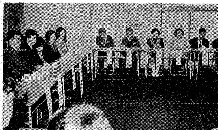
市政モニター・市職員

発行所 新潟市役所 新潟市西通6番町 866 電話 代表 61000 編集人 中島正二 印刷所 (株) 文明堂印刷所