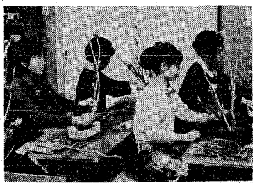
ホームで人気のある生け花教室