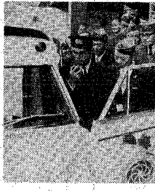
救急車へ無線機 南ライオンズが寄贈

本市消防本部の救急隊に取付けの無線機を寄贈した。この無線機は、山形県産の無線機で、消防本部に寄贈された。