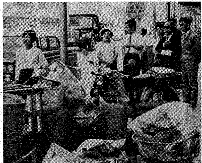
一日モニター職員として活躍する四十四年度の市政モニター

市では、皆さんの意見を市政に反映させようと「市政モニター」を次の要領で募集しています。ふるってご応募ください。