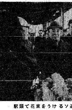
駅頭で花束をうけるソ連代表団

ソ連代表団東港を視察 去る二月四日、ソ連代表団が新潟市東港に到着し、視察を行いました。代表団は、東港の港湾施設や産業振興について、関係者から説明を受けました。 代表団は、東港の港湾施設や産業振興について、関係者から説明を受けました。東港は、新潟市の重要な産業地帯であり、港湾施設の整備や産業振興は、地域の発展に大きく貢献しています。