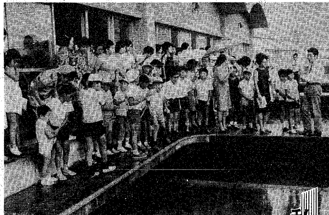
1日、市役所ビル約30分に当たる8万トンの飲料水をつくらせている鳥屋野浄水場

新潟市中央卸売市場は十月一日で開設五周年を迎えます。開設以来、畜産物の集約、各種新鮮の安全な流通機構近代化に貢献、市民の暮らしの向上に貢献、食生活の改善などに役立っています。