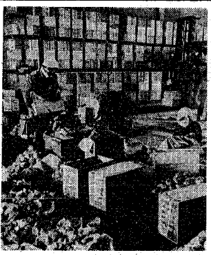
新潟近郊産なす(トマン)の輸出検査(昨年)

姉妹都市 新潟の衣類など輸出 市貿易 早稲田産(田)とリトルタクト(金)の輸入業務の開始が完了した。 これは、去七月ハロウズ市で行われた貿易協議会(新潟市と北日本貿易協会)で、于五十万ドルの繊維製品を輸出する契約が結ばれた。