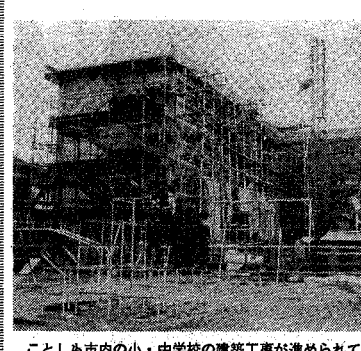
ことしも市内の小・中学校の建築工事が進められている

新橋市の教育行政の方向は、トナツ懸念に対する対策は、プレハブ教室の設置... 市教育委員会審議会の審議を経て、その要否を判断した。