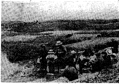
▲浜遊山 (明治44年) 新潟海岸の砂丘は幾重にもなっており、グミや浜ナスで美しい市民の憩いの場所でした。家族づれや、近所の人を誘い合せて、弁当をもって砂丘に遊びました。当時の人は浜遊山(はまゆざん)と呼んでいました。