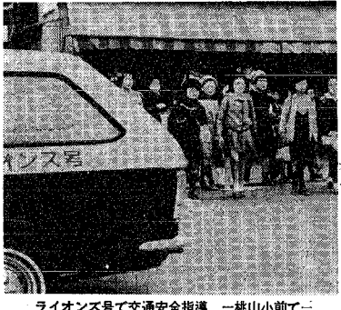
ライオンズ号で交通安全指導 一統山小前にて

交通安全指導車を寄贈 交通安全指導車を寄贈。交通安全指導車を寄贈。交通安全指導車を寄贈。