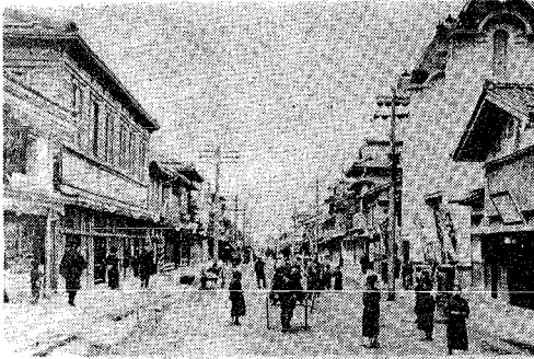
大正時代の古町6番町。5番町の方からカメラでとらえた写真です。左の2階建ては地球館、通称観光場と呼び、小間物、玩具などを売っていました。