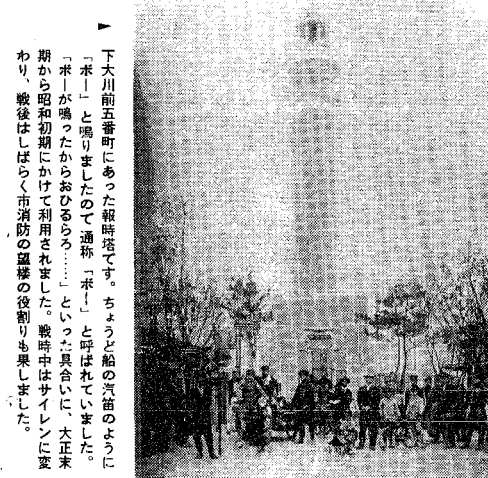
下大川前五番町にあった報時塔です。ちょうど船の汽笛のように「ボーン」と鳴りましたので「ボーン」と呼ばれていました。