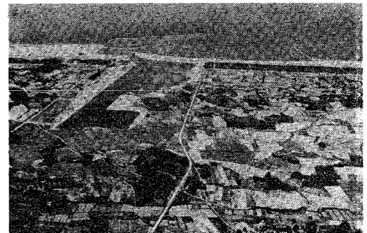
将来の対岸貿易と日本海側の重要な臨海工業地帯となる新潟東港

和田 新潟市の発展は、港を中心とした。公共事業費は、二千億円以上。これは、戦後最大の投資額である。そのうち、港の整備に約千億円が投入されている。これは、港の発展を促すための重要な投資である。