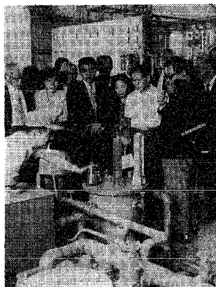
船見終末処理場で汚水処理について熱心に説明を聞く市政モーター

市長モーター さる九月十七日、モーター三千名、下水道見学、受益者負担制度について、説明会が開かれた。