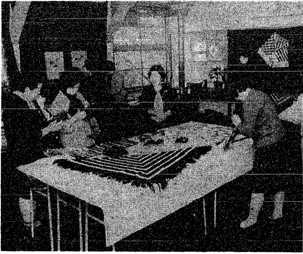
「これどうかしら良くできているわね」にきわったバザー会場

身障児対策にむけて、品定めをすすめてきた。白の会が主催するバザーの利益を、身障児対策に寄付する。白の会が主催するバザーの利益を、身障児対策に寄付する。