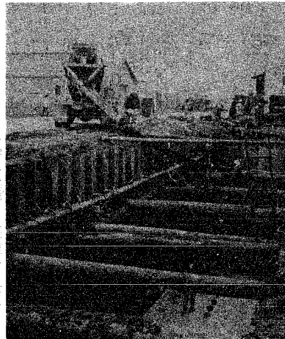
↑着々進む幹線下水道工事(木戸地区)