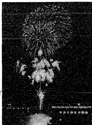
↑4年ぶりに打ち上げられた花火