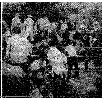
↑被害を最少限に食い止めた8・28水害