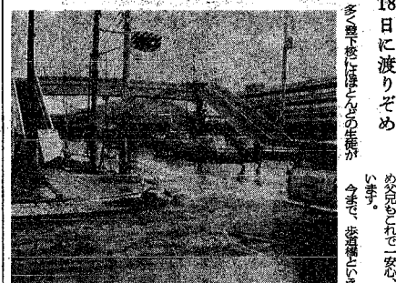
南万代小の前に完成した歩道橋<11日撮影>