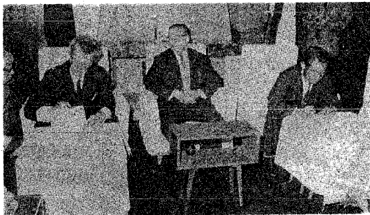
新潟市長の立ち会いのもとに行なわれた姉妹都市貿易調印

姉妹都市ハロンスタットの姉妹都市調印を経て、従来六十万の貿易が実現し、来る十月十四日市役所で調印式を挙げる。その中で、両市の貿易促進として日本貿易振興会の上級指導者と調印式が調印式の内容として、今後とも調印が行なわれていく。