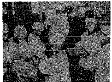
「食事は衛生的に……」とマスク、エプロンを着用して配膳する給食係り