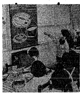
栄養知識はクイズや資料を使って。

湊小学校給食指導員が、四年生、四年生の児童に、クイズで栄養の指導をした。その結果、大臣賞を受賞した。