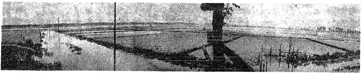
▲ 最高水位のとき、中野小屋の早濁一帯は湖と化した。写真は40センチも減水した後だが、まだ農道は水路に見える。(30日写す)