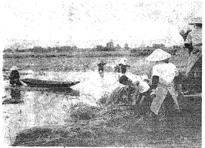
▼ 濁流は防がれた。濁川地区の農家は援農隊と一体になって稲の取り入れに忙しい。(松濁地内で 9月1日写す)