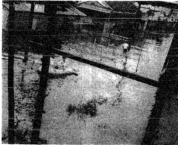
▲ 山木戸地区は8月28日から29日にかけての集中豪雨で一面川のようになった。(29日写す)