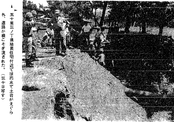
▲ 五十嵐三ノ丁果臈員住宅付近では雨水で土台がえぐられ、道路が根こそぎ流された。(三十日写す)