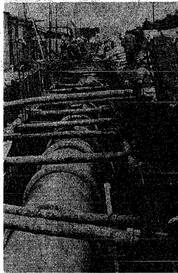
下水道管施設は、新市域の建設

基本的な設計は、この下水道整備の五年計画に基き、新市域でも水洗の普及を進めていく。下水道局は、第五年度計画から、この五年計画は水洗化促進、新市域の下水道整備が大きな特色となっている。