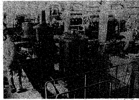
下水道の終点、ポンプ場

新市域の第五年度計画は、浸水対策、汚水処理、水洗化促進の三つの柱となっている。浸水対策は、第五年度計画から、この五年計画は水洗化促進、新市域の下水道整備が大きな特色となっている。