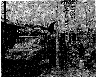
ゴミの積み上げもたいへんなゴミ収集作業