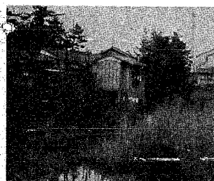
関屋の堀割りの様子。写真は、関屋の歴史を語る重要な要素である。

関屋の堀割りは、新潟市の歴史を語る重要な要素である。この堀割りは、関屋の歴史を語る重要な要素である。この堀割りは、関屋の歴史を語る重要な要素である。この堀割りは、関屋の歴史を語る重要な要素である。