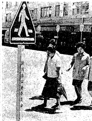
横断歩道を渡りましょう

調製は、九月五日現在で、九月十五日現在までに完了しています。 九月五日現在、新潟市では、基本選挙人名簿の調製が完了しています。九月十五日現在までに完了しています。