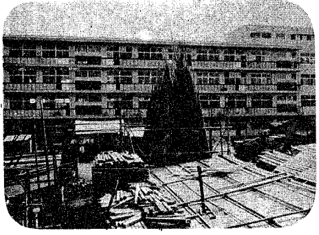
写真は完成した市立工業高舎