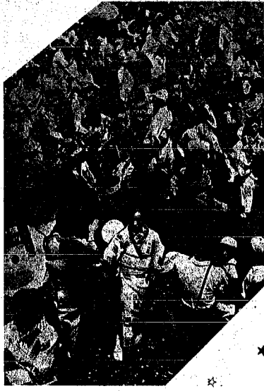
新潟芸妓道中のおどり