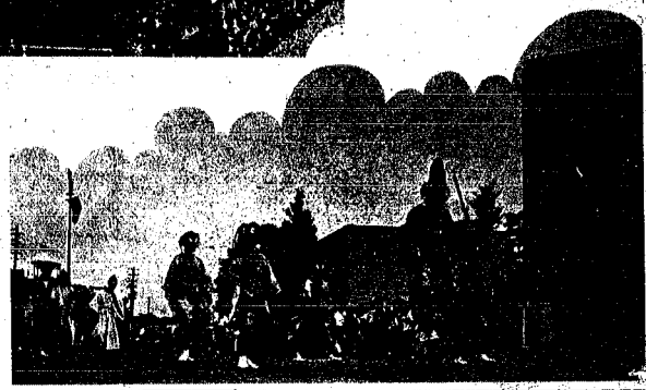
住吉祭りの天狗さま