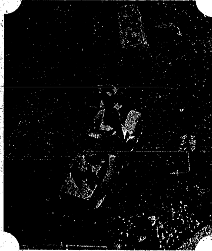
商工祭山車の行進