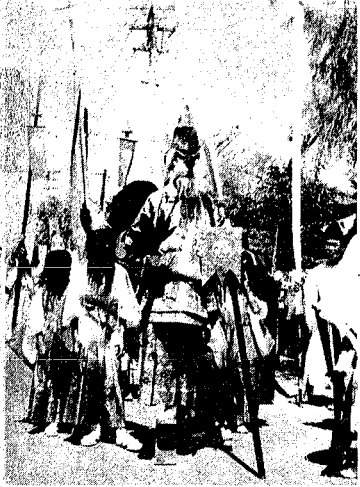
↑住吉祭りの天狗さま