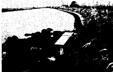
新川 (升岡新田地内)