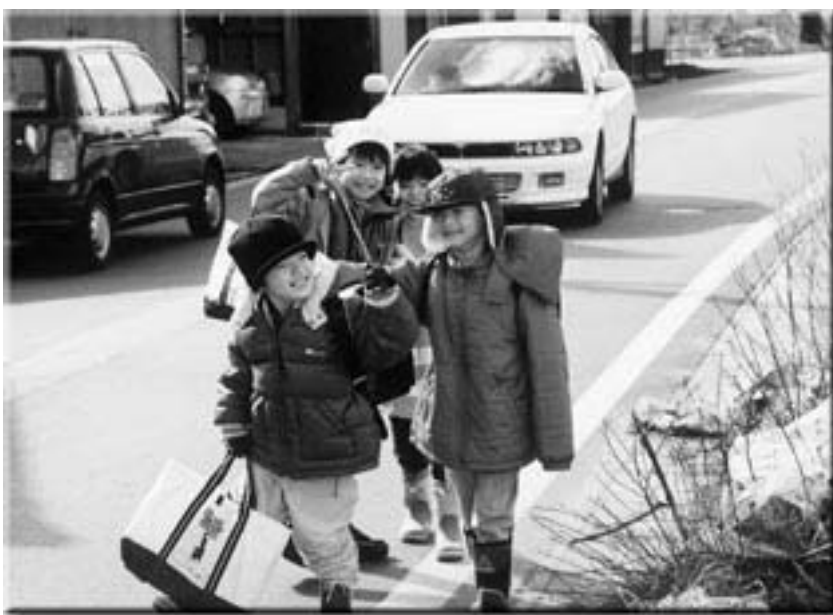
まだ寒さの残るこの時季、児童は元気よく下校していました。