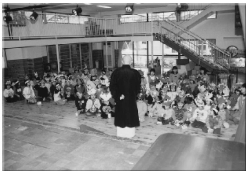
節分の日、豆まきにまつわる話を一生懸命聞いていました。