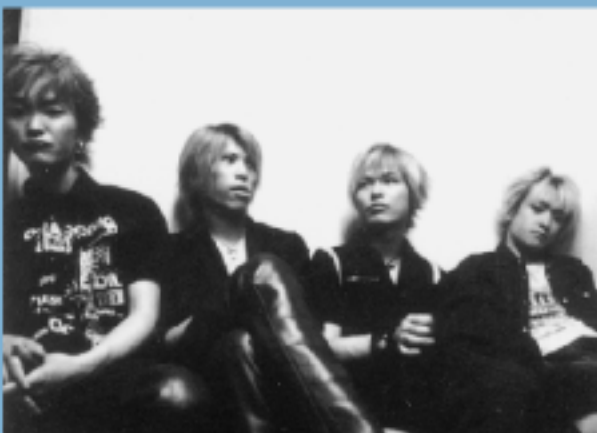
スパーク・スパークス

8/23(土) 午後7時30分から 西川町福祉会館裏公園広場特設会場 ※雨天の場合、西川勤労者体育センター(ふれあい公園内)