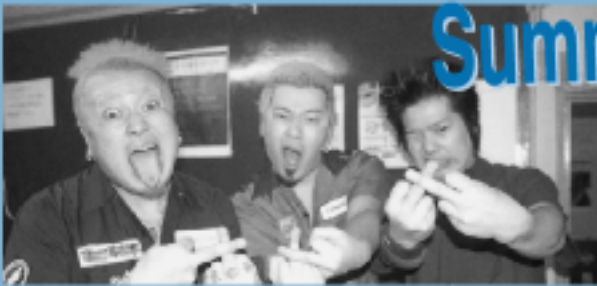
ジョリー・ピクルス