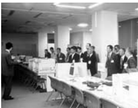
◀ オフサイトセンター内にて

措置法が公布され、全国の原子力施設所在地に緊急時対応の拠点として緊急事態応急対策拠点施設（オフサイトセンター）が整備されることになったものです。