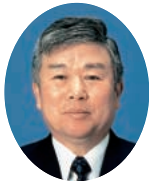
西川町長 安沢 節英