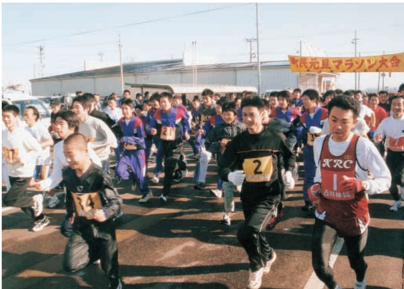
町民元旦マラソン大会