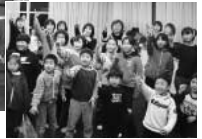
みんなでジャンケン大会もしました。