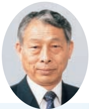
西川町議会議長 森山 邦衛