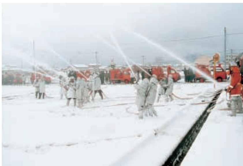
無火災を願って行われた出初め式 (1月5日 JA西川本所駐車場にて)