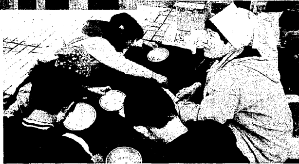
子どもたちに大人気の金魚すくい

招き、「ちよつと変わった農業・ワイン作り」と題して、農業振興講演会が開催されました。 食の安全に対する意識が高まる中、地元産の安心・安全・新鮮な農産物の良さを広めていく良い機会となりました。