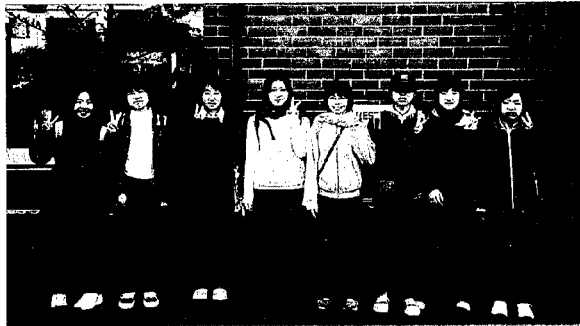
前年度の参加者の皆さん

海外研修・町民研修事業に参加したことのある人は応募できません。ただし、全額自己負担の場合は応募できます。また、同一年度に兄弟姉妹で応募することはできません。