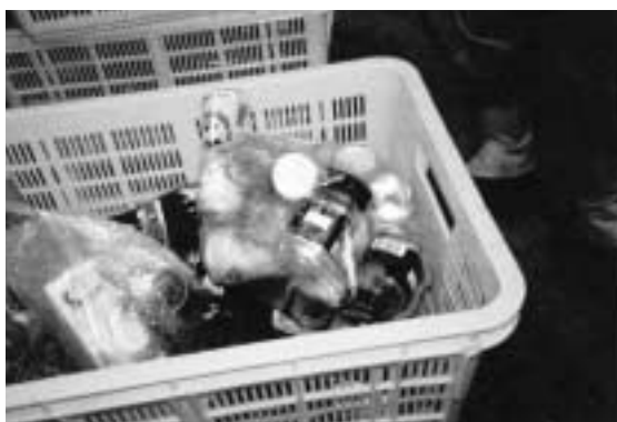
袋に入れてあったり、異物の混入がある悪い例