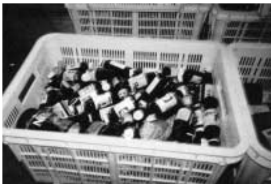
キャップが取られていないビン