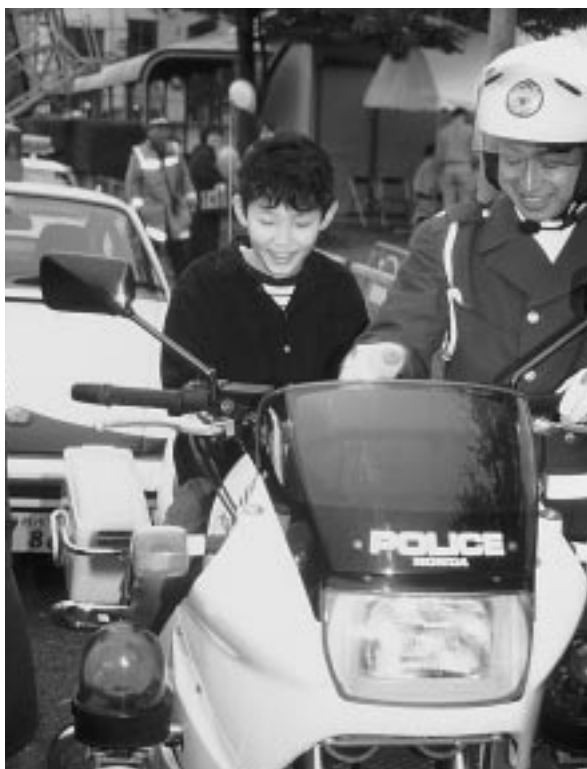
白バイって、カッコいいな!

町では、生涯学習推進計画を策定し、生涯学習に対する行政支援を積極的に取り組むことに