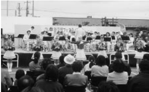
県警音楽隊のすばらしい演奏