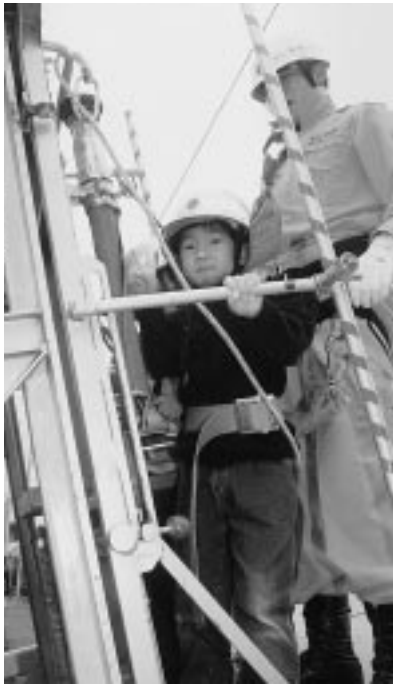
はじめて消防車にのったよ！ ちよっと恐かったけど、 楽しかったよ！