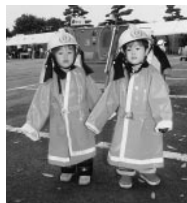
ぼくたち、ちびっこ消防士だよ