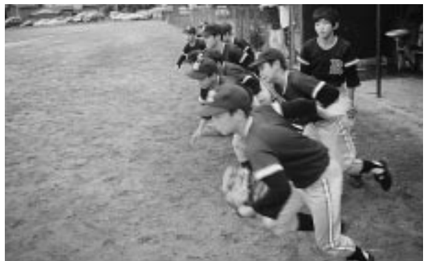
いくぞーと元気にグラウンドに飛び出す選手たち

て練習しています。一学期も、毎日練習をやっていました。がんばってやったおかげで、西川町親善陸上大会では、走り高とびで一位をとることができました。