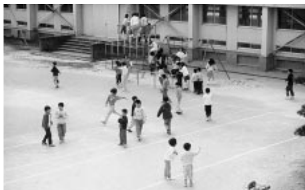
休み時間には、みんな元気で外で遊ぶ (鎧郷小学校にて)

これは、ある本に書いてあった言葉でわたしがすごく気に入ってるものです。「怖いから逃げ出したって思うんじゃない。逃げたいって思うから怖くなる。」この言葉を読んですごく元気ができました。そして、悲しい時は、楽しいことを考えるように私は心がけています。逃げないで、いじめられている人を見て見ぬ振りはないと決心しました。それが「優しさ」だろうと思っています。