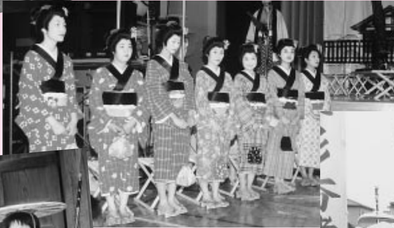
今年の娘役の みなさん