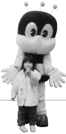
生涯学習のマスコット 「マナビィ」は会場で大人気