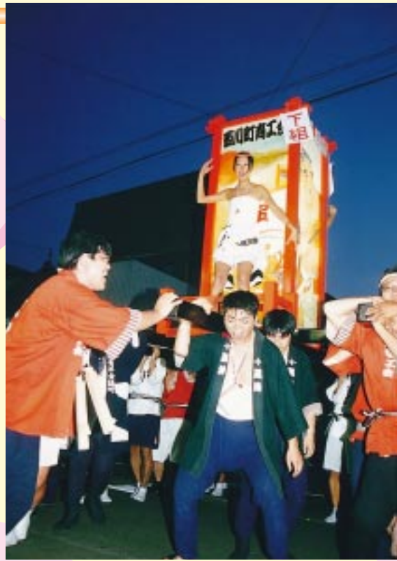
ソイヤ ソイヤ 活気つく福みこし