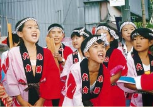
ワッショイ！ワッショイ！ 子どもみこしは元気いっぱい