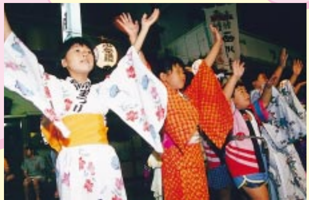
子どもから大人まで みんな一つになって踊った民謡流し