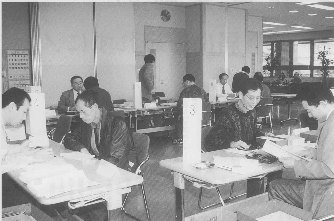
ふれあいルームでの納税相談