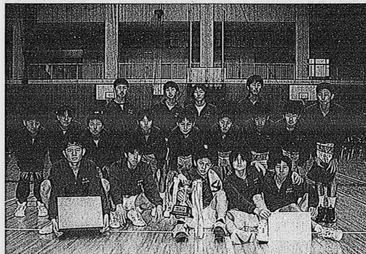
優勝した 西川中バスケットボール部

西川町体育協会主催による近郷中学校球技大会が、西川中学校などを会場に開催され、中学1、2年生のファイトあふれるプレーにより、体育館内は熱気と歓声に包まれました。