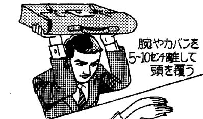
腕やカバンを5-10センチ離して頭を覆う