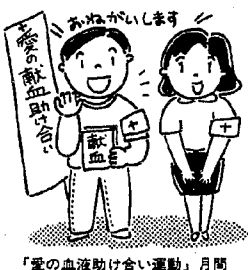
「愛の血液助け合い運動」月間