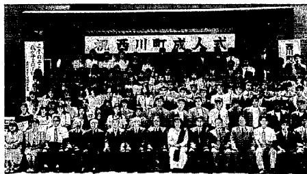
昨年のスナツから

8月15日(火)に政府主催による全国戦没者追悼式が行われます。式典当日の正午には、役場のサイレンに合わせて、戦没者を追悼し平和の祈念をこめ、それぞれの職場または家庭において1分間の黙とうをお願いします。