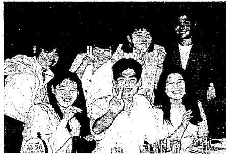
なつかしい顔が集う

新成人の皆さん、おめでとーございます。 平成7年の西川町成人式を、8月15日(火)に福祉会館講堂で行います。 今年対象になる方は、昭和49