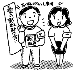
「愛の血液助け合い運動」月間