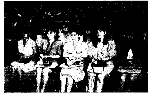
▲昨年の記念式典で

現在、他町村・他県にお住い の方も出席できますので、福祉 会館内社会教育課(☎88-23 34)に早めにご連絡ください。