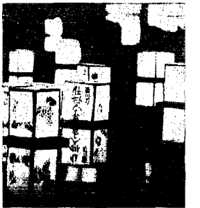
▲西川にたゆたう灯籠

夏の思い出 西川灯籠流し 夏休みの思い出として、子ど もたちから人気のある「西川灯 籠流し」を行います。 夕涼みがてら、親子で西川の 幻想的な灯籠を見に来ませんか。 日時 8月22日 午後6時集 合(7時に灯籠を西川 に流します) 会場 西川ふれあい公園水辺 広場 内容 ・灯籠コンテスト ・みんなで歌おう ・灯籠点火式ほか ※ 灯籠を自分で作りたい方に は、材料(有料)を差し上げ ます。 スタッフ募集 夏の夜の夢を再現する西川 灯籠流しのスタッフを募集しま す。