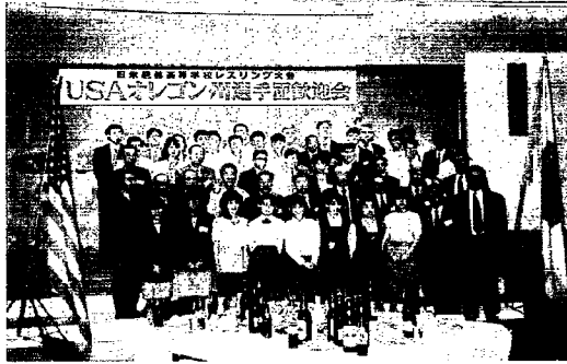
歓迎レセプション

り、大会当日の24日も、西川中学校の授業見学や給食をいっしょに食べるなど交流を深めました。 大会結果は、米国選手の圧勝（10戦全勝）で、県選抜チームは、世界との差を文字どおり肌で感じる結果となりましたが、試合終了後行われた町長主催の歓迎レセプションでは、お互いの健闘を讃え合い、高校生同士楽しく交流していました。