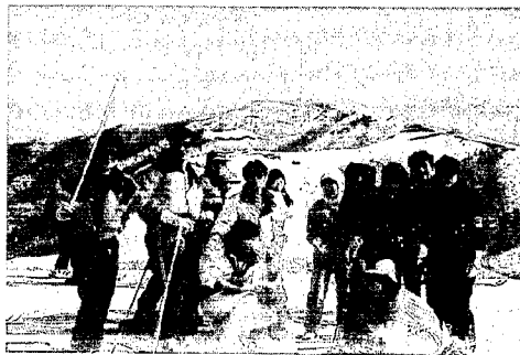
▲わきあいあいとスキーを楽しむ若者

西川町青年サークル主催の「ヤングスキーの集い」が去る三月十一日、塩沢町の舞子高原スキー場で開催され、町内外から三十二名の若者が参加しました。このスキーの集いは、若者の