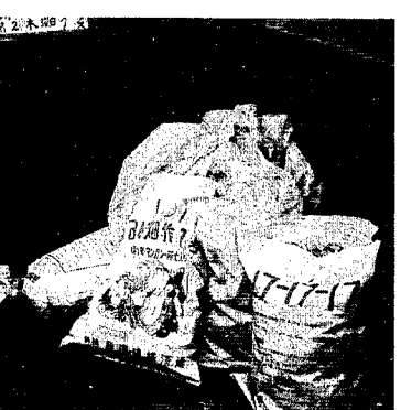
これはいけません!

ゴミ収集車は持って行きませんが、また、誤って処理場に搬入されてしまうと処理場の焼却炉などの故障や損傷あるいは有毒ガス発生の原因になりますので、皆様のご協力をお願いします。 (個人で処理しなければならぬゴミ) 事業活動に伴う産業廃棄物 古タイヤ類など(個人も含む) 廃ビニール類 発泡スチロール プラスチック類