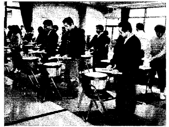
タルで練習している風景

第3回西川町近郷中学校柔道大会 西川中第3位 三月五日(日)西川中学校柔道場において、西蒲原郡内七中学校が参加して開催されました。 ○団体戦 優勝 巻西中学校 準優勝 黒埼中学校 三位 西川中学校 三位 吉田中学校 会場に響き渡る選手達の気合いと、力の限り闘う熱気とで大気が盛り上がり、今後の健闘を約束して、無事に終了しました。