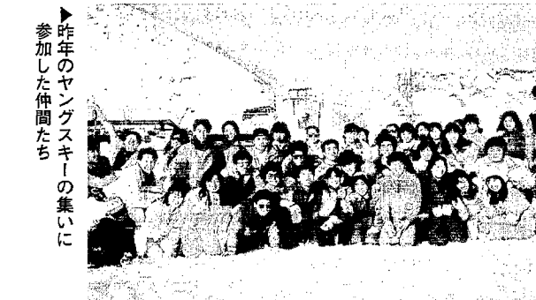
▶ 昨年のヤングスキークの集いに参加した仲間たち