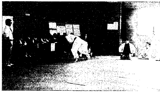
西川中柔剣道場で行われた柔道新人大会風景

日時 十一月二日午前十時から十一月四日午後四時まで 会場 西川荘および社協センタ