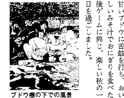
ブドウ園の下での風景