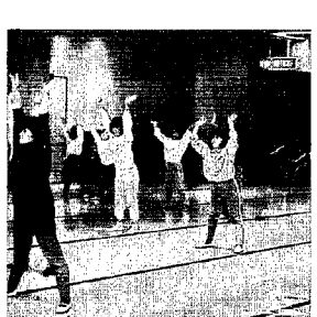
エアロビクスダンス講習会

いま、女性を中心に人気をよんでいるエアロビクスダンスの講習会を、去る四月二十二日、西川町体育指導委員協議会と西