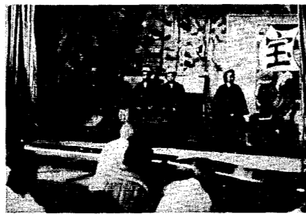
いってわかりやすく、表情や身振りも上手で、演劇部十四人は練習の

去る八月七日、高砂学級では、恒例になった西川中学校演劇部との世代間交流をはかりました。 会場の西川荘は、朝からの猛暑の中、町のマイクロバスやスクーターバスで、一〇〇人以上の参加がありました。 今年は、「バナナ(バナナ)と殿様」という題名で、殿様と百姓の間で、バナナという果物をどう処置するか思慮するという劇でした。セリフや発声もはつきりして